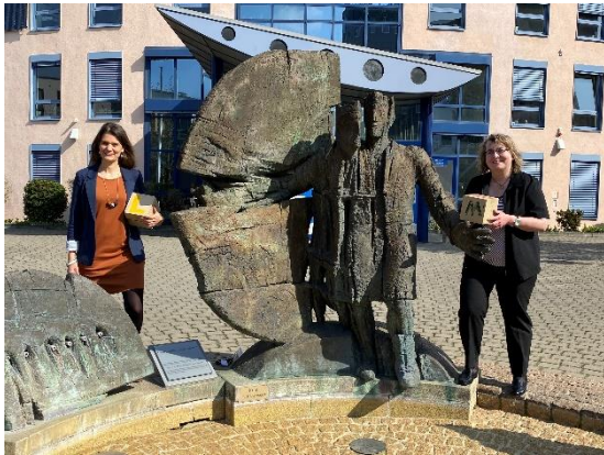
KV Mainz-Bingen / D. Gebhard

Damit das Ganze auch gut funktioniert, gibt es im Landkreis noch die Koordinierungsstelle, die für eine gute Zusammenarbeit sorgt. Diese Stelle ist allerdings nicht direkt mit der Hilfe betraut, sondern steuert das Gesamtprojekt.